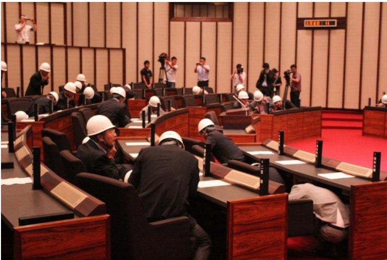
シェイクアウト訓練 議場での様子

災害対策の課題を把握するため、平常時より「大分市議会防災会議」（災害時には「大分市議会災害時対策会議」に移行）を設置。議員は、7つの地区組織いずれかに所属している。また、20名の議員が防災士の資格を取得している（定数 44名）。