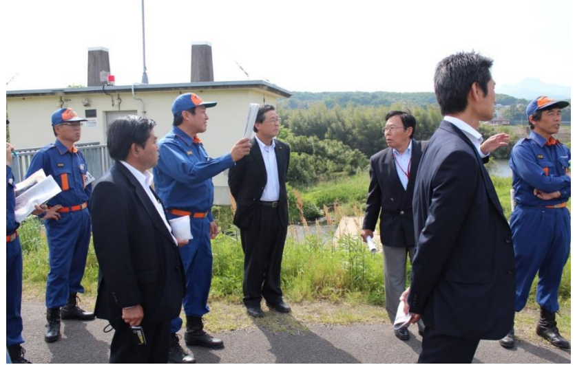
地区組織で危険箇所を見回る様子