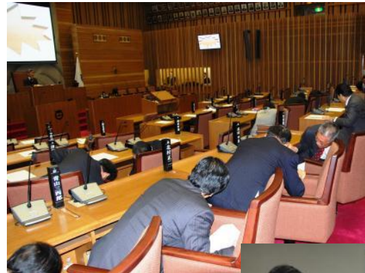
議場を使っでの 防災訓練 (26.11.4)